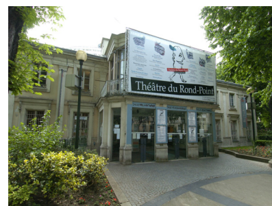
Théâtre du Rond-Point Paris 8ème

Le principal avantage apporté par cette solution est une plus grande sérénité de la part des utilisateurs qui ne reçoivent plus une centaine de spams par jour, mélangés aux emails professionnels. Et bien évidemment un gain de temps non négligeable, à la fois pour eux et pour les administrateurs. Cependant, un temps d'apprentissage relatif est à prévoir pour les utilisateurs, le temps d'en intégrer parfaitement le fonctionnement.